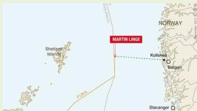
Map of the Martin Linge field (Total)

В резултат на това Total открива газ и кондензат в образуванията Tarbert, Ness и Etive в групата Brent, с "добро" качество на запасите.